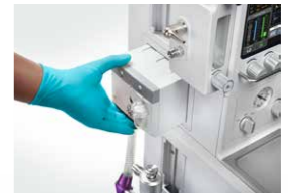
Nuevo control P-n-P