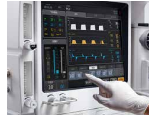
Completamente táctil y sin teclas

El revolucionario control completamente táctil y sin teclas le permite comunicarse con el sistema de anestesia como nunca antes. Un control de mouse y un panel táctil de respaldo le permiten controlar fácilmente el acceso tanto sentado como de pie.