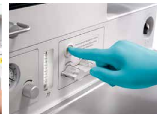
Medidor de flujo automático de respaldo