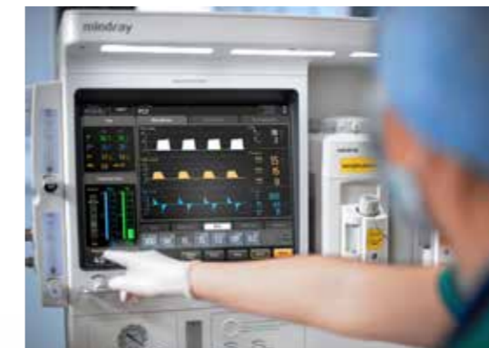
Mezclador de gases digital

Retorno de muestra de gases: El control de retorno de gases de muestra al circuito respiratorio le permite ahorrarse el costo de gases médicos y agentes anestésicos y, al mismo tiempo, reduce el desecho de gases.