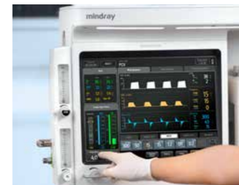
Mezclador de gases digital

En caso de que el mezclador de gases digital no funcione, se empleará un medidor de flujo mecánico de respaldo con O_2 +AIRE/ N_2O .