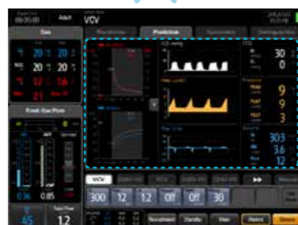
Predicción de AA y oxígeno

Al igual que la predicción de AA, la tendencia muestra la tendencia de O 2 del flujo de gases nuevos, tanto para FiO 2 como para EtO 2 .