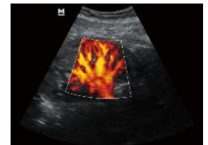
Flujo en riñón con Power Doppler