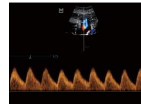
Flujo de arteria umbilical